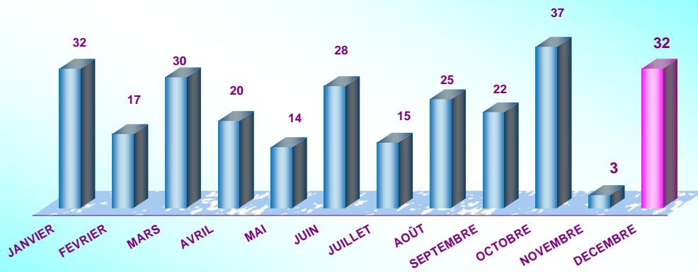
Titres Traités en STICODEVAM de Janvier à Décembre 2008