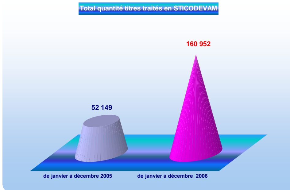
Total quantité titres traités en STICODEVAM